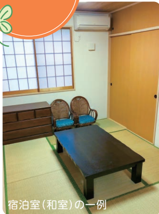
宿泊室(和室)の一例