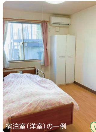
宿泊室(洋室)の一例